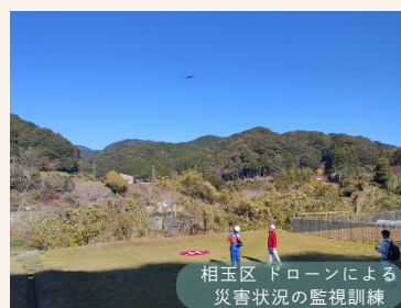
相玉区 ドローンによる災害状況の監視訓練