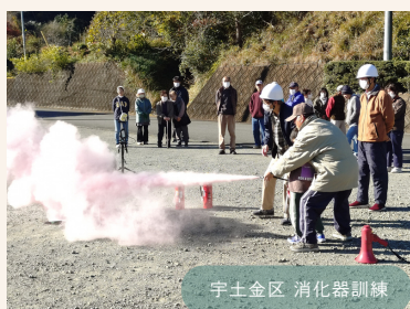
宇土金区 消化器訓練

「地域防災の日（12月の第1日曜日）」に合わせ、「地域の特性に応じた防災体制の確立」と「市民の防災意識の高揚による減災の実現」を目的に、自主防災組織を中心として、各地域の特性に合わせた訓練を実施しました。