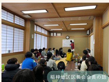
稲梓地区区長会会長の話

大学生と触れ合う機会が限られている下田市にとって、高校生や地域の方々にとっても、非常に貴重な交流の場となりました。