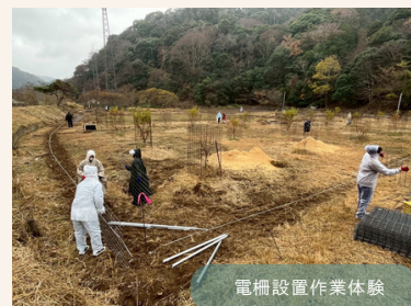
電柵設置作業体験